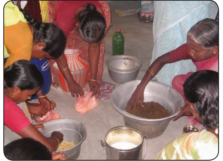
தாவரக் கரைசல் தயாரிப்பு குறித்த செயல்முறை விளக்கப் பயிற்சி