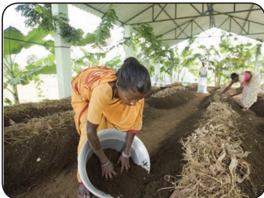
மண்புழு உரத்தை அறுவடை செய்தல்

சுக்கன்கொல்லையிலுள்ள நமது ஆய்வுப் பண்ணையில், கத்தரி, நிலக்கடலை, தர்பூசணி, நெல், பயறு வகைகள் மற்றும் வைத்தியக்கும்பளம் பயிரிடப்பட்டுள்ளன. மாதிரி வீட்டுக் காய்கறித் தோட்டத்தில் முள்ளங்கி, வெண்டை, வெங்காயம், அவரை போன்ற காய்கறிகள் பயிரிடப்பட்டுள்ளன. செம்மை நெல் சாகுபடி முறையில் 42 சென்டில் குள்ளகார் நெல் ரகம் சாகுபடி செய்யப்பட்டுள்ளது. மண்புழு உரத் தயாரிப்பு மற்றும் அசோலா வளர்ப்பு மேற்கொள்ளப்பட்டு வருகிறது.