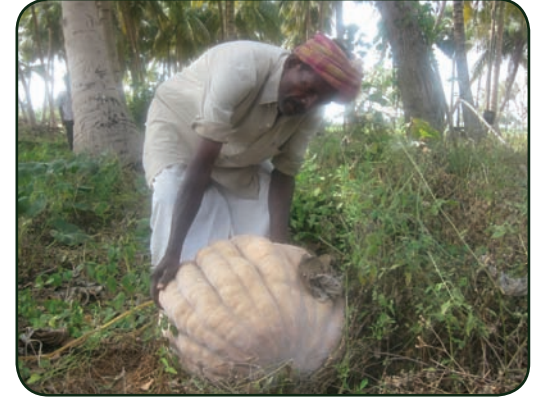
ராமநாதபுரம் மாவட்டத்தில் பாதுகாக்கப்பட்டு வரும் பாரம்பரிய பூசணி ரகம்

இந்தத் திட்டம் ஃபோர்டு மற்றும் ஹீவால் நிறுவனங்களின் உதவியுடன் திருவண்ணாமலை மாவட்டத்திலுள்ள ஜவ்வாதுமலை மற்றும் திண்டுக்கல் மாவட்டத்திலுள்ள செந்துறை பகுதியிலுள்ள 15 கிராமங்களில் 1345.81 ஏக்கரில் செயல்படுத்தப்பட்டு வருகின்றன. மாதாந்திர சங்கக் கூட்டங்கள் நடத்தப்பட்டன. சென்ற பருவத்தில் 590 ஏக்கரில் சாகுபடி செய்யப்பட்டிருந்த பேய் எள், கொள்ளு, மக்காசோளம், சாமை, உளுந்து மற்றும் நிலக்கடலை போன்றவை அறுவடை செய்யப்பட்டுவிட்டன. பயனீட்டாளர்கள் இயற்கைவழி வீட்டுக் காய்கறித் தோட்டங்களை உருவாக்கி பராமரித்து