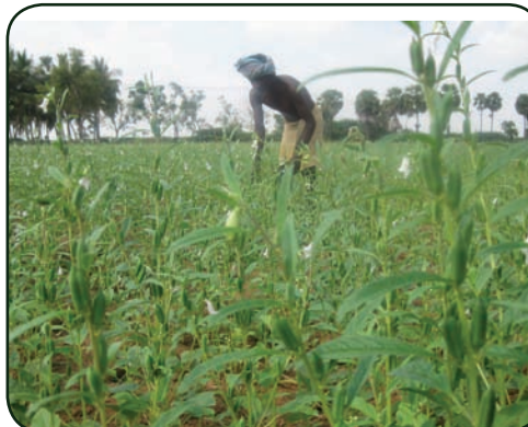
திண்டுக்கல் மாவட்டம், களத்துப்பட்டி கிராமத்தில் உள்ள இயற்கைவழி எள் வயல்

இந்தத் திட்டம் மும்பையிலுள்ள ஜாம்செட்ஜி டாடா டிரஸ்டிஸ் (JTT) உதவியுடன் காஞ்சிபுரம், ராமநாதபுரம், திண்டுக்கல் மற்றும் நாகப்பட்டினம் மாவட்டங்களில் மே 2009 முதல் செயல்படுத்தப்பட்டு