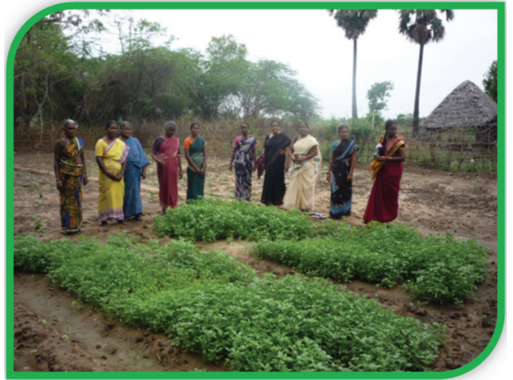
சமுதாயக் காய்கறித் தோட்டத்தில் பொன்னி பெண்கள் சுய உதவிக் குழு உறுப்பினர்கள்

நாகப்பட்டினம் மாவட்டத்திலுள்ள ஆதமங்கலம் கிராமத்தில் சமுதாயக் காய்கறித் தோட்டம் ஒன்று உருவாக்கப்பட்டுள்ளது. ஊட்டச்சத்து பாதுகாப்பின் முக்கியத்துவம் குறித்த விழிப்புணர்வை ஏற்படுத்துதல், பாரம்பரியக் காய்கறி ரகங்களைப் பாதுகாத்தல் மற்றும் குழுவாகச் செயல்படுவதை ஊக்கப்படுத்துதல் போன்றவை இந்த முயற்சியின் முக்கிய நோக்கங்கள் ஆகும். பத்து சென்ட் நிலப்பரப்பில் அமைக்கப்பட்டுள்ள இந்தக் காய்கறித் தோட்டம் பொன்னி பெண்கள் சுய உதவிக் குழுவினால் பராமரிக்கப்பட்டு வருகிறது. இவர்களுக்கு தேவையான, பயிற்சிகள் மற்றும் தோட்டத்தைப் பார்வையிட்டு ஆலோசனைகளை வழங்குதல் போன்ற தொழில்நுட்ப உதவிகளும், பல்வேறு பாரம்பரியக் காய்கறி ரகங்களின் தரமான விதைகளும் நமது மையத்தினால் வழங்கப்பட்டன. களையெடுத்தல், தண்ணீர் பாய்ச்சுதல், தாவரக் கரைசல்கள் மற்றும் மக்கு உரத்தைத் தயாரித்து உபயோகித்தல், அறுவடை போன்ற அனைத்து செயல்பாடுகளையும் குழு உறுப்பினர்களே மேற்கொண்டு வருகின்றனர். இந்தச் சமுதாயக் காய்கறித் தோட்டம் சுற்று வட்டாரங்களில் உள்ள கிராமங்களுக்கு ஒரு மாதிரி தோட்டமாகவும் விளங்குகிறது. இதைப் பார்வையிட்டு சென்ற அநேக பெண்கள் தங்கள் வீடுகளில் காய்கறித் தோட்டங்களை உருவாக்கி பராமரித்து வருகின்றனர். இதன் மூலம் பல பாரம்பரியக் காய்கறி ரகங்கள் பாதுகாக்கப்பட்டும் அவற்றின் விதைகள் சேமிக்கப்பட்டும் வருகின்றன.