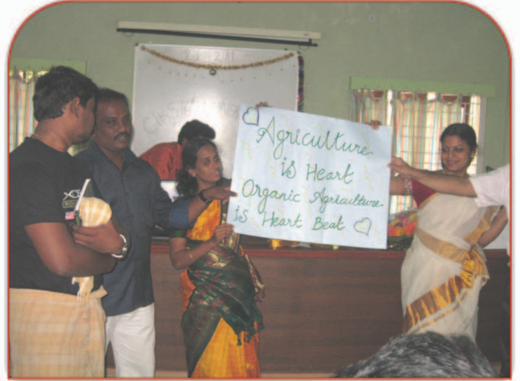
இயற்கைவழி வேளாண்மையின் முக்கியத்துவம் குறித்த கலை நிகழ்ச்சியில் பங்கு பெற்ற பணியாளர்கள்